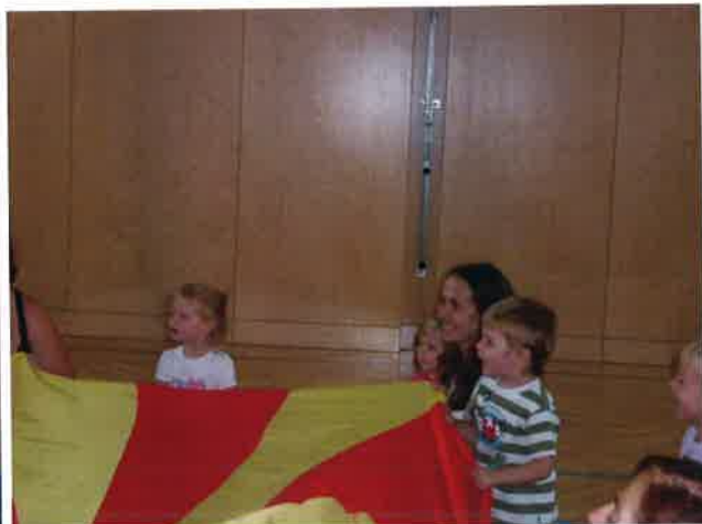
Viel Spaß und Bewegung in der Kinderturnstunde

Wir wünschen allen verletzten und erkrankten Sportkameraden und Vereinsmitgliedern alles Gute und baldige Genesung