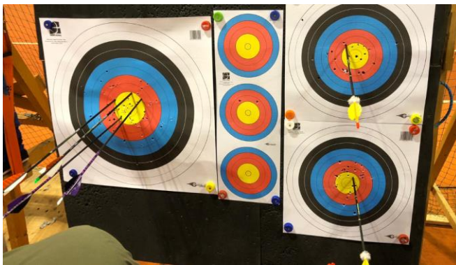
Super-Passe mit 54 Ringen (von 60 möglichen)